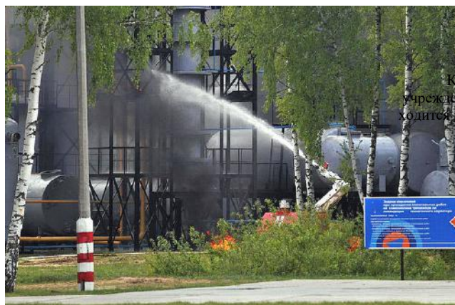
Краевое учреждение ДПО находится по адресу:

воздержаться от употребления водопроводной или колодезной воды, а также овощей и фруктов из огородов и садов до заключения специалистов об их безопасности.